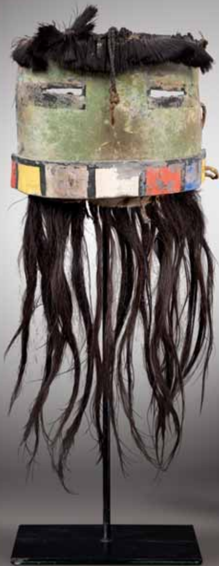
17. ANGAKTSINA - Masque facial semi-circulaire, ANGAK'CHINA (Colton 127). HOPI [ou] ZUÑI. Fin XIX e siècle.

[ Long-Haired Kachina. Kachina-aux-Longs-Cheveux.