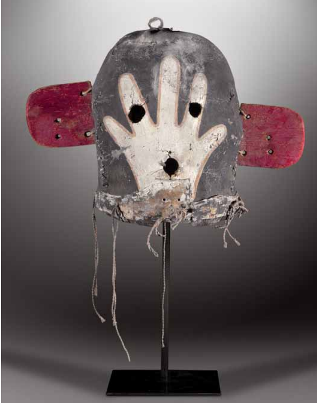
70. SIVU'IKWIWTAQA - Masque Heaume SIVU-I-QILTAQA, Hand Kachina (Colton 114) aussi MATYAWKATSINA - MATIA : Kachina-Porteur-de-Main. HOPI, Arizona. Ca. 1910.