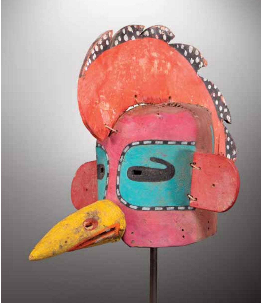
46. KOWAKO - Masque heaume KOWAKO ou Rooster Kachina ou Chicken Kachina (Colton 82). Kachina-Poulet. HOPI, Arizona. Ca. 1930

Masque en cuir rouge, les yeux percés en rectangle entourés de noir en forme de virgule sur fond turquoise encadré d'un filet blanc et noir en alternance. Le bec en bois peint en jaune et rouge ajouré, oreilles en bois rouge, le chef surmonté d'une crête de coq en bois rouge et découpes de plumes en noir à points blancs. A l'arrière, deux traits verticaux turquoise de part et d'autre. Cuir de réemploi (selle mexicaine). Patine intérieure d'usage, bois, cuir et pigments naturels avec repeints.