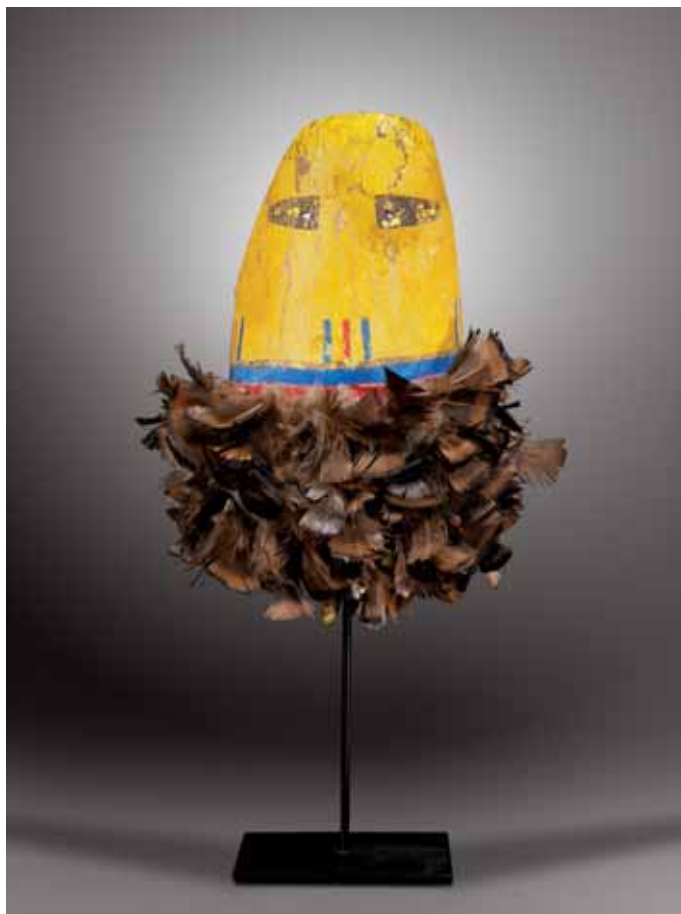
19. Masque facial. Demi-masque RIO GRANDE, « Guerrier... » - JEMEZ, Nouveau-Mexique - (voir celui de la collection MATTA 1998, cat. de Paris : p. 107 : 50). Ca. 1920-1930

Masque facial en cuir sur fond jaune, les yeux incisés de forme triangulaire dans un encadrement triangulaire peint en noir. La bouche n'est pas évoquée, les bords inférieurs sont peints de deux lignes parallèles bleues et rouges surmontées de trois verticales bleues et rouges.