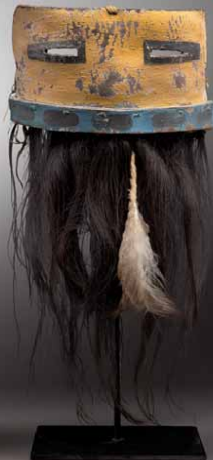
18. TAKURMANA - Masque TAKUS MANA - Yellow Corn Maiden (Colton 129). HOPI, Arizona. Ca. 1920-1930