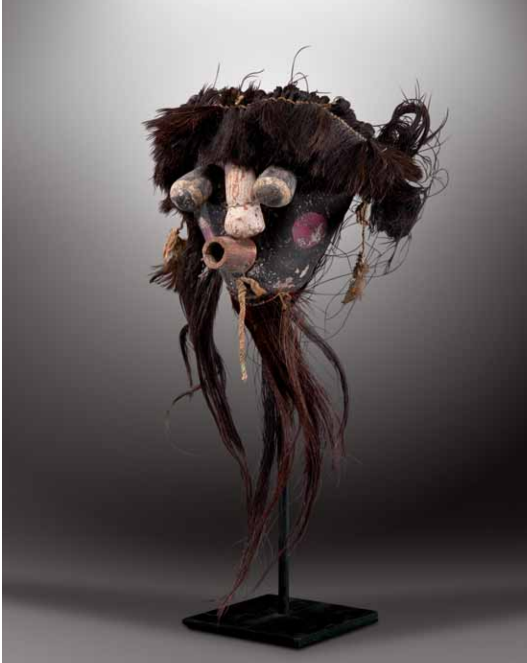
50. TSA'KWAYANA SHOYADTA - Très rare Masque facial : - CHAKWAINA SHO-ADTA-Grand-Mère. - CHAKWAINA (Colton 162).